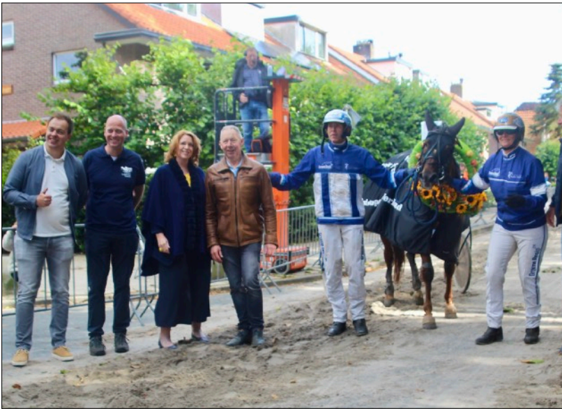
Medusa J, hier na de winst in Warmond, was met afstand de meest succesvolle in Nederland gefokte kortebaner van 2024.