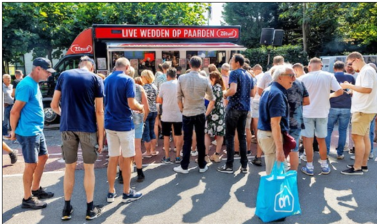
Heemskerk was één van de 14 kortebanen die een nieuw record noteerden.

Na het recordjaar van 2023 was iedereen benieuwd naar het resultaat van 2024. Het begon al goed. In Wognum kon meteen een flinke recordverbetering genoteerd worden. Deze recordverbeteringen bleven maar komen: maar liefst 14 van de 26 kortebanen mochten een 'all-time high' noteren. Inmiddels traditiegetrouw heeft Santpoort veruit de hoogste omzet. Geheel in stijl met de stijgende trend realiseerde deze kortebaan een nooit bereikte omzet van € 174.321. Een verbetering