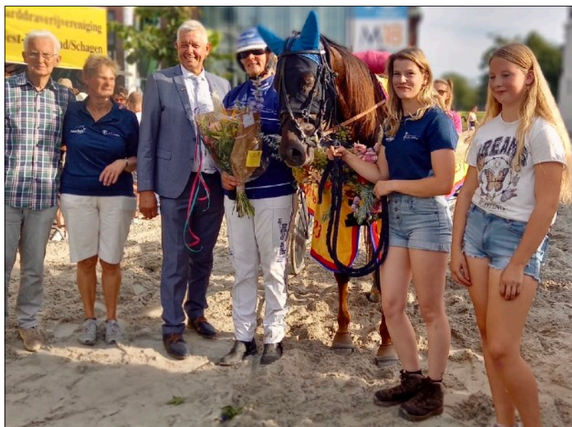
De 4-jarige Medusa J was de beste in Schagen.