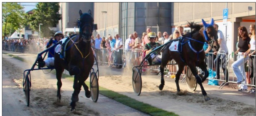
Felle strijd tijdens het NK in Purmerend tussen Hampshire F Boko (links) en Candy Blue Chip.

Dit jaar was Purmerend het toneel van het Kampioenschap van Nederland. De prijzenpot was met € 10.750 riant gevuld. Daarnaast kwam er ook nog voor wel € 10.000 aan prijzen en vergoedingen op tafel, zoals voor reiskosten (€ 250), een pikeursvergoeding van € 125 en talrijke ereprijzen waaronder de traditionele uitrijssulky. De finale werd