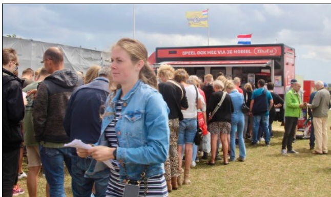
Het was nog nooit zo druk voor de kassa's van ZEturf.

Na het recordjaar van 2019 en het voorzichtig herstel van de coronaperiode dat 2022 liet zien, was het spannend of de omzetten weer een vlucht zouden nemen. We weten inmiddels het antwoord: 2023 gaat de boeken in als een recordjaar. Uiteindelijk ging er € 1.092.671,50 door de kassa's, ruim € 90.000 meer dan het oude record. Voorlichtingsavonden in Assendelft, Venhuizen en Wognum hebben hun uitwerking niet gemist. Alle drie boekten aanzienlijk meer omzet. Twaalf kortebanen hebben hun omzetrecords gebroken. Santpoort kwam tot het ongelooflijke bedrag van € 157.387, dit is bijna € 10.000 meer dan het oude record van vorig jaar. Heemskerk deed ook een grote stap voorwaarts. Voor het eerst kwam de