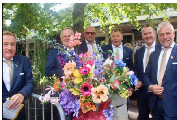
Bloemenweelde in Roden met het bestuur.

De 26 organiserende verenigingen hebben gezamenlijk een bedrag van € 147.900 aan prijzengeld bij elkaar gebracht. Met een gemiddelde van € 5.688 is dit hoger dan ooit. Naast dit prijzenbedrag zoals bij de uitschrijving vermeld, hebben de organisaties € 32.873 aan bonussen en extra premies uitbetaald. Dit jaar kwamen ook € 69.375 aan reiskostenvergoedingen op tafel. Er zijn dit jaar 551 starts op de kortebaan geweest. Dit levert een fokpremie op van € 2.775.