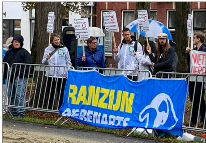
Ondanks de aandacht voor het welzijn van de paarden vonden deze demonstranten het maar niets, wat er op de Maliebaan gebeurde.

bij het faculteitsbestuur van de Universiteit Utrecht. De kortebaan dreigde te worden afgeblazen, maar mede op aandringen van ons bestuur werd de organisatie toch doorgezet. De studenten zagen in dat het belangrijk was te laten zien dat de draf sport niet dieronvriendelijk is. Voorafgaand aan de draverij werd een paneldiscussie met deskundigen en voor- en tegenstanders georganiseerd en alle paarden werden voor de wedstrijd aan een veterinaire check onderworpen. De deelnemers lieten zich bovendien in alle opzichten van hun beste kant zien. Een handjevol demonstranten meende desondanks getuige te zijn van veel dierenleed, maar de paarden gingen soepel en het publiek zag een prachtige draverij op het Maliebaanparcours.