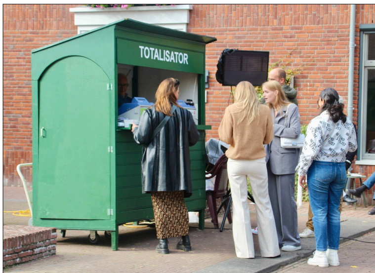
Een korte rij in Medemblik, maar wel een lokale recordomzet van € 52.107!

Het toch wat grillige omzetbeeld is anders moeilijk te verklaren. Aan het begin en aan het einde van het seizoen rolden nieuwe records uit de bus. Het middengedeelte was een stuk minder goed. Natuurlijk zal het weer een rol spelen en daarmee de bezoekersaantallen, maar of dat nu de verklaring is? De telkens terugkerende verwarring van een afwijkend duo-/triospel op de paarden in de G-16 (individuele startnummers, in plaats van koppelnummers) in vergelijking met het reguliere programma leverde in elk geval soms felle discussie op. Bij de samenstelling van de koersprogramma's werd bij herhaling vergeten de kolom met koppelnummers te verwijderen, wat de nodige kopzorgen heeft veroorzaakt bij ZEturf.