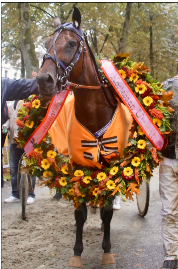
Over mooie ereprijzen gesproken. Epoque draagt de winnaarskrans in Utrecht..

De 25 organiserende verenigingen hebben gezamenlijk een bedrag van € 135.875 aan prijzengeld bij elkaar gebracht. Met een gemiddelde van € 5.435 is dit gemiddelde hoger dan ooit.