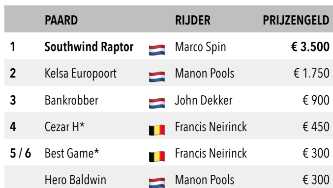
Tabel 1: uitslag interland Nederland-België (Santpoort, 4 augustus 2022)

België plaatsvond. Het werd een draverij met zestien paarden: acht Nederlanders en acht Belgen volgens het G-16 principe. Er werd gewoon geloot, met in de eerste omloop ritten van Nederlanders tegen Nederlanders en Belgen tegen Belgen. Toen de rook van de eerste omloop inclusief de herkansingsronde was opgetrokken, bleken de Belgen toch meer tegenstand te hebben geboden dan verwacht. Zeven Nederlanders en vijf Belgen hadden de tweede omloop bereikt. Het werd een echt spektakelstuk. Uiteindelijk bleken de Nederlandse paarden en pikeurs toch meer ervaren, maar het was zonder meer een succes. Het smaakt naar meer. Vanuit Ruiselede kwam het bericht dat in 2023 de tegeninterland kan worden gehouden. Nu nog een plaatsje op de kalender vinden.