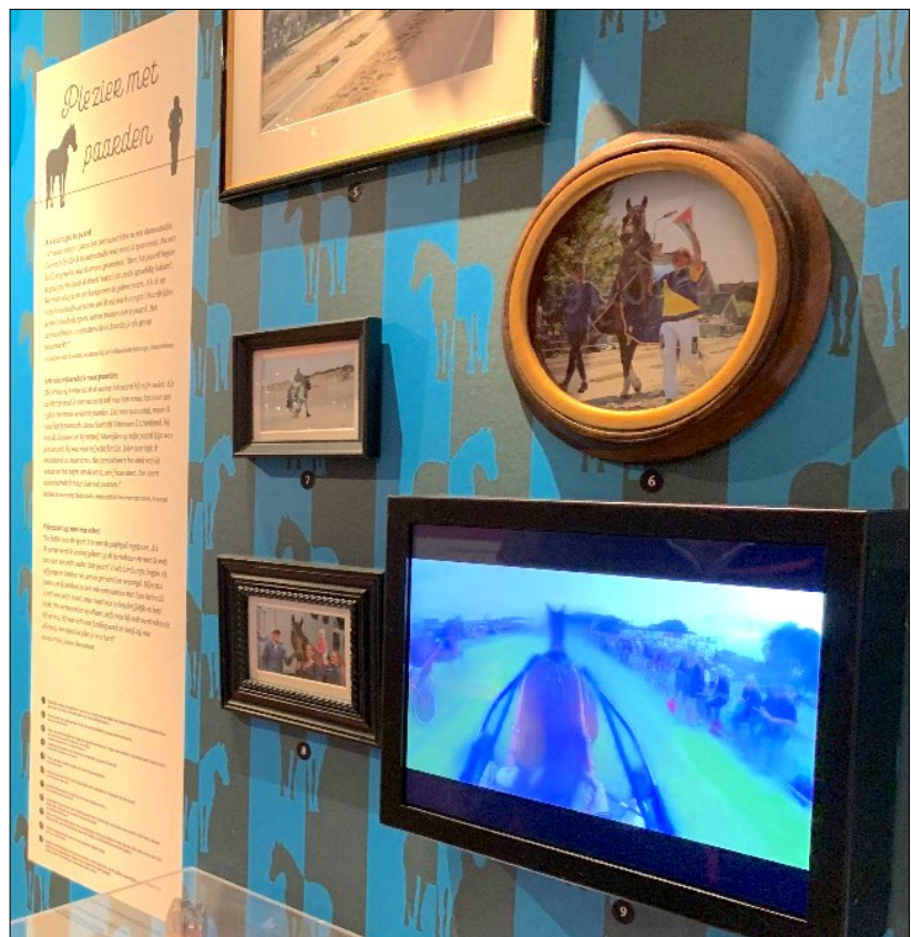
Een deel van de tentoonstelling in Rotterdam.

Voor de liefhebbers: de tentoonstelling is nog te zien tot en met 30 januari 2022 in het Natuurhistorisch Museum, Westzeedijk 345 (Museumpark), 3015 AA Rotterdam. Toegang € 8,00 voor volwassenen, € 4,00 voor kinderen en 65+ of helemaal gratis met een Museumkaart.