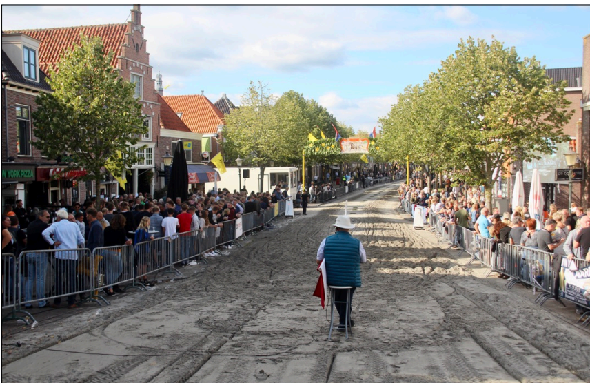
Medemblik organiseerde de eerste kortebaan op locatie.

'Goed begonnen, half gewonnen' is een bekende uitdrukking in de kortebaanwereld. Dit jaar is het precies andersom. We zijn niet zo goed begonnen. Door de coronamaatregelen konden de eerste 20 (!) kortebanen op hun eigen locatie niet doorgaan. De veiligheidsregio's gaven geen toestemming. Strenge eisen aan inrichting van parcours, aan de bezoekers en aan veiligheidsmaatregelen, maakten het de verenigingen onmogelijk.