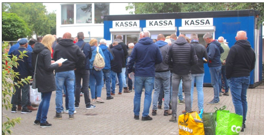
Lange rijen voor de kassa's in Lisse. Daar werd ook de hoogste omzet geboekt: € 60.146.

De totalisatoromzet is uitgekomen op € 243.381,50 ( specificatie in bijlage 3 ). De verenigingen die het aangedurfd hebben hun kortebaan op Duindigt of Emmeloord te organiseren, werden hiervoor bij totalisator niet beloond. Nootdorp, Santpoort, Warmond en Hoofddorp hebben hiervan echt te lijden gehad. Grote hulde voor deze verenigingen die het organiseren aangedurfd hebben en hun financiële mogelijkheden hebben benut. Bij tien kortebanen is een gemiddelde van € 24.381 behaald. Ten opzichte van het topjaar 2019 (toen € 40.002) is dit een aanzienlijke achteruitgang. Het bondsbestuur en de kortebanen gaan, in samenwerking met Zeturf, acties ondernemen om het verloren gegane terrein minimaal te heroveren.