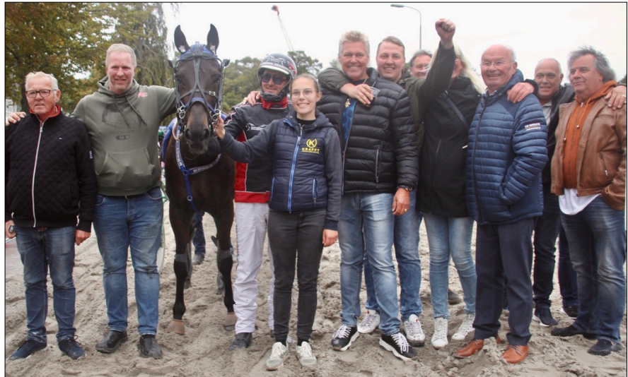
Stal De Groningers viert de overwinning van Chief One in Lisse.