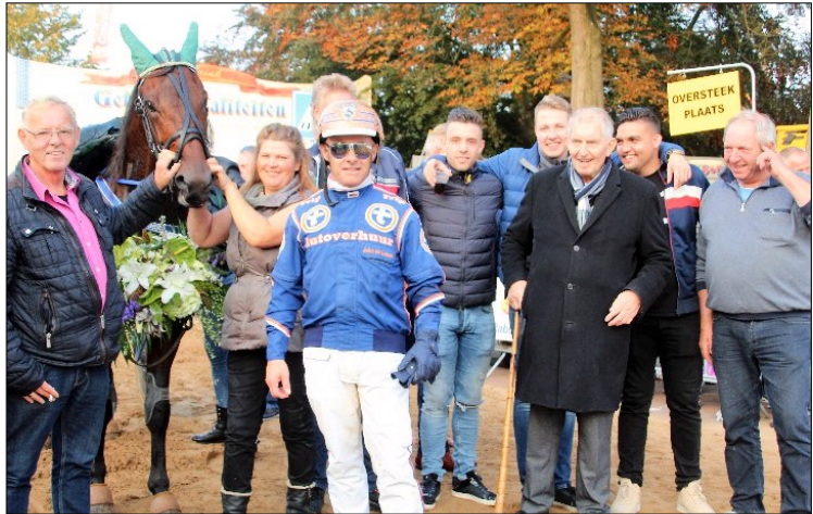
De Groningers vieren hun feestje na de overwinning van Diesel Scott in Roden.

Met slechts één paard (Southwind Raptor) wist ook Bert de Boer tot de top 5 door te dringen. Met een kennersoog en een beetje geluk is het nog steeds mogelijk om voor weinig geld een goede kortebaner te kopen.