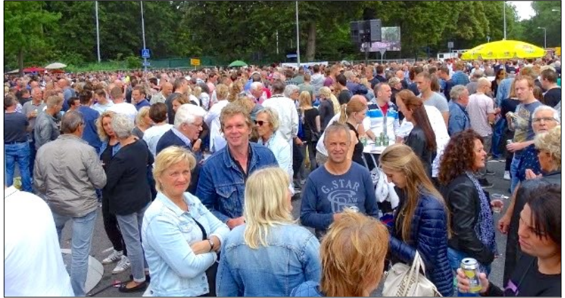
De druk bezochte kortebaam van Heemskerk.

Het was weer een mooi seizoen. Duizenden mensen langs de baan, meestal volle velden, en spannende ritten. Nieuwe cracks zijn opgestaan en de 'oude' garde heeft zich kranig geweed in het veld van nieuwkomers. Ook dit jaar was de publieke belangstelling weer enorm.